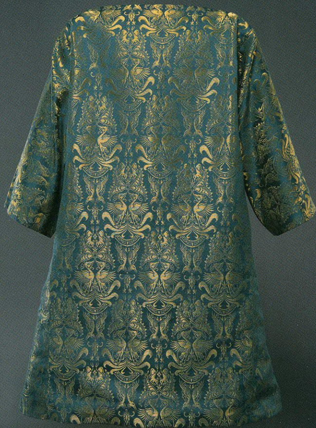
Kopie dalmatiky Karla IV. (?) nebo Jiřího z Poděbrad (?)

Katedrála má bohatou sochařskou výzdobu především zásluhou jejího druhého stavitele Petra Parláře, který byl sám vynikajícím sochařem.