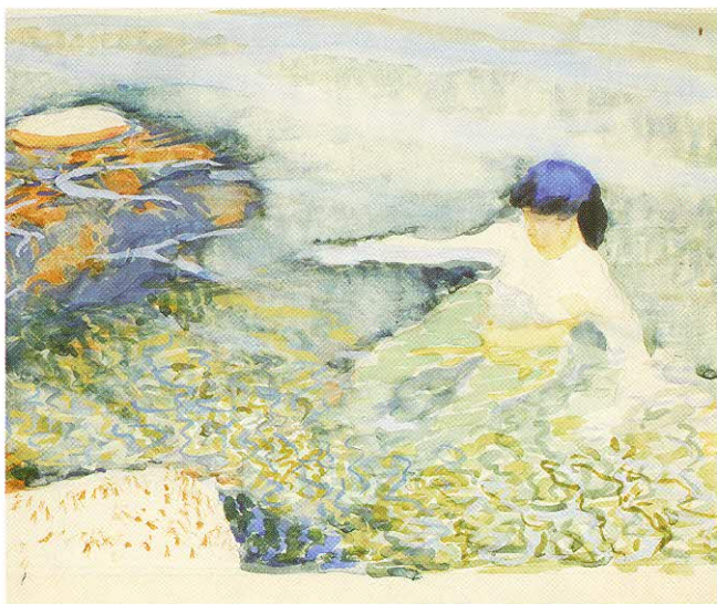
Studie ke Koupající se / Study for the Bather; asi 1906–1907 / cca. 1906–1907; tužka, akvarel na papíře / pencil, watercolour on paper; 265 × 375 mm Museum Kampa

Museum Kampa od svého otevření v roce 2003 prezentuje osobnost a tvorbu Františka Kupky. Tento snad nejdůležitější český malíř 20. století, většinu svého života žijící ve Francii a udržující stálý kontakt s pražským prostředím, je pro Kampu více než jenom mnoha dily dobře zastoupeným autorem – je zejména osobně spjat s mecenáškou, sběratelkou a zakladatelkou Muzea Kampa Medou Mládkovou. Meda se s Kupkou pravidelně setkávala v Paříži už od dob svých studií dějin umění na Sorbonně a postupně získala řadu jeho děl, včetně jednoho ze dvou prvních veřejně prezentovaných nefigurativních obrazů vůbec, Amorfu – Teplou chromatiku , poprvé vystavenou na pařížském Podzimním salonu v roce 1912.