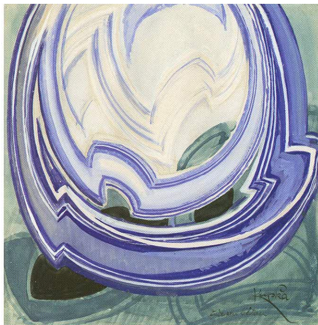
Étude pour l'Estérel / Studie pro l'Estérel / Study for Estérel; 1921–1922; kvaš na papíře / gouache on paper; 225 × 230 mm Oblastní galerie Liberec / The Regional Art Gallery in Liberec

Soustředění se na určité, přesně specifikované téma pomůže pochopit způsob práce, uvažování autora, známého důkladným promyšlením svého uměleckého záměru.