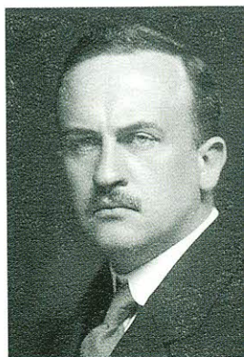
Jan Kotěra (1871–1923)

Dílo nejvýznamnějšího představitele naší moderní architektury Jana Kotěry do knihy o českém kubismu zdánlivě nepatří. Vznikalo v letech 1912 až 1913, tedy ve stejné době, kdy byla dokončena nejslavnější stavba jeho žáka Josefa Gočára – dům U Černé Matky Boží. Zřejmě tehdy na domácí scéně probíhal nevyhlášený, ale o to zřetelnější souboj mezi geometrickou modernou a příznivci kubismu. Zatímco Jan Kotěra nikdy nepodleh vábení originálního pojetí, jeho mladší souputníci a žáci teprve po několika letech zjistili, že kubistická architektura je sice zajímavá, nicméně neskýtá možnost dalšího vývoje.