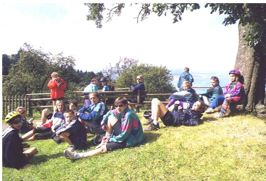
vpravo: ... po svačince jsme se na sluníčku oddali nedělní siestě ...