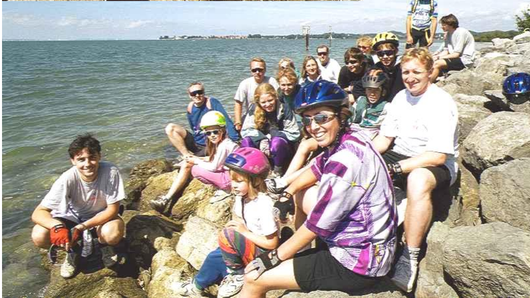
dole: BBCC a Bodamské jezero

12,23 - 12,52 - poměrně dlouho jsme seděli na teplých kamenech u hladiny jezera, vystavovali se slunečním paprskům, poslouchali jsme něžné šplouchání vln, fotili jsme se a oddávali jsme se volné konverzaci, ale nemilý fakt, že musíme balit, nás přece jenom přesvědčil k návratu do Bregenzu