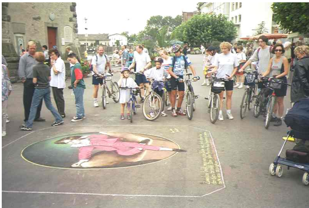
... BBCC na kolonádě v Lindau ...