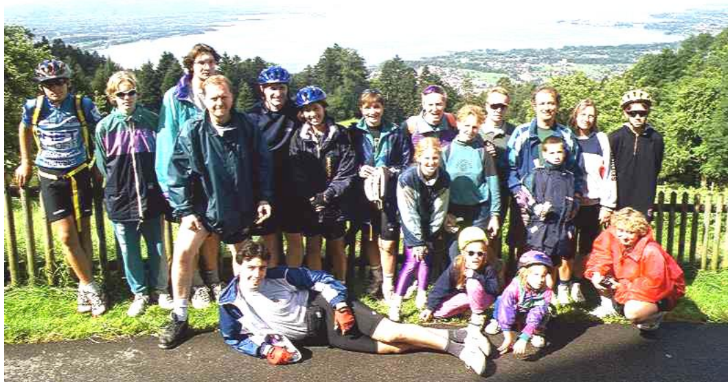
nahore: ... vyhládka na Bodamské jezero ...