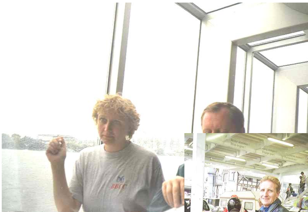
... Vrstevnice a Mirek aneb za vytrvalého deště opouštíme na lodi německý Friedrichshafen ...

15,32 - nás zbylých 14 členů BBCC se nalodilo na loď směrem na Romanshorn