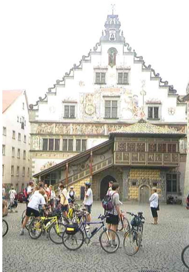
... BBCC před historickou radnicí v Lindau ...